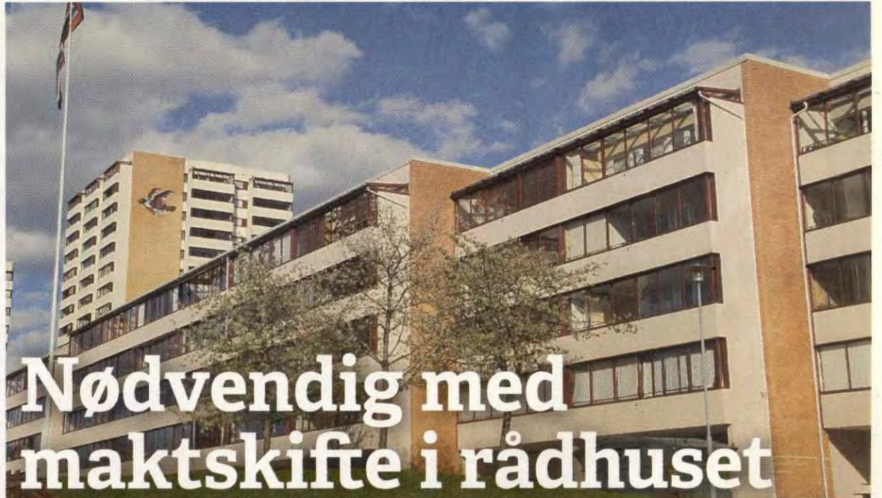
Bomiljø: Blokker på Trosterud.