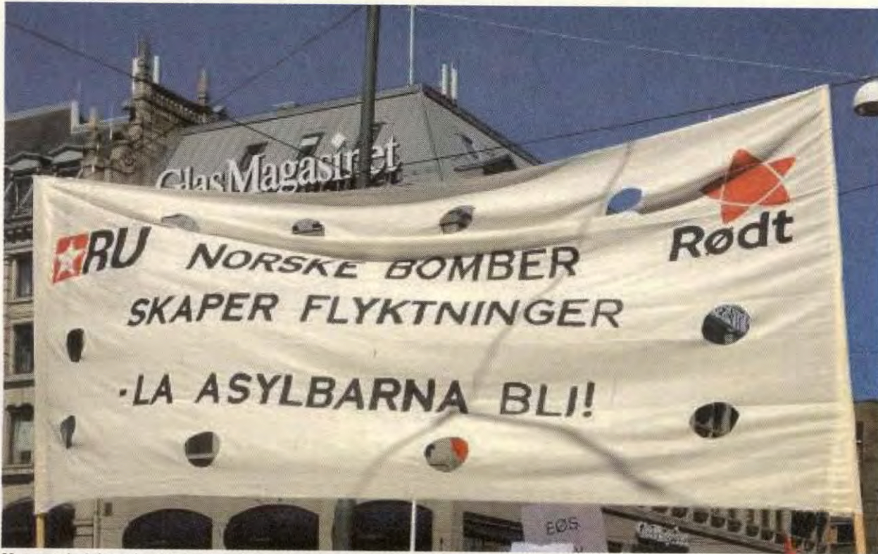
Mot norsk deltagelse i krig: Fra demonstrasjon i Oslo den x.