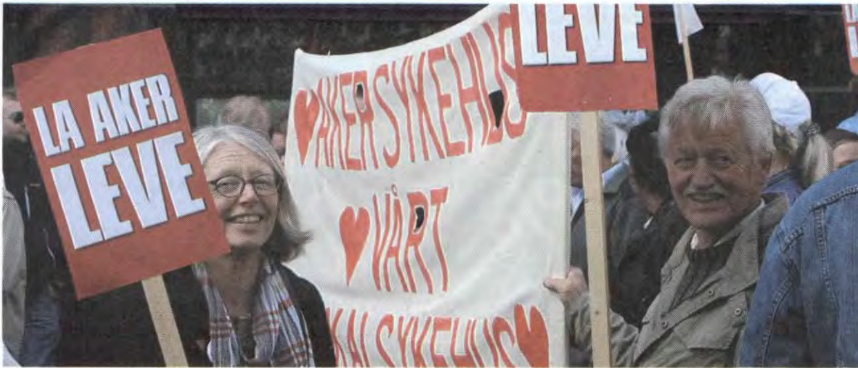
La Aker leve: Rødt vil gjenreise Aker som lokalsykehus i Oslo.