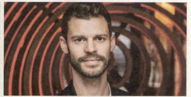
Rødt-leder: Bjørnar Moxnes.