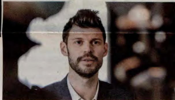
Rødt-leder: Bjørnar Moxnes.

– Rødt vil derimot reversere kuttene, øke skattene for de rikeste og bruke pengene på å styrke velferden.