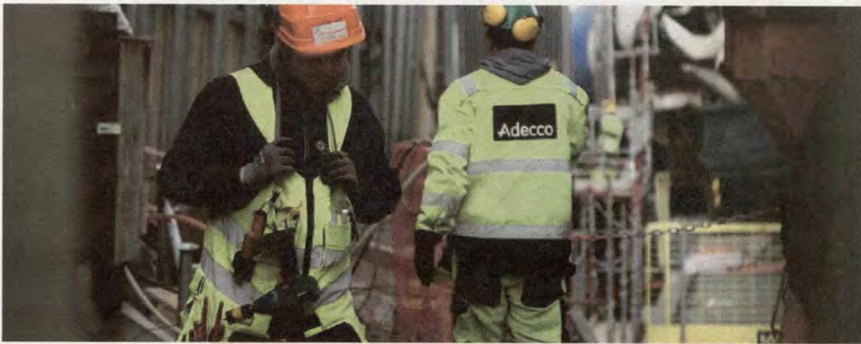
Truer arbeidslivet: Rødt vil forby bemanningsbransjen.