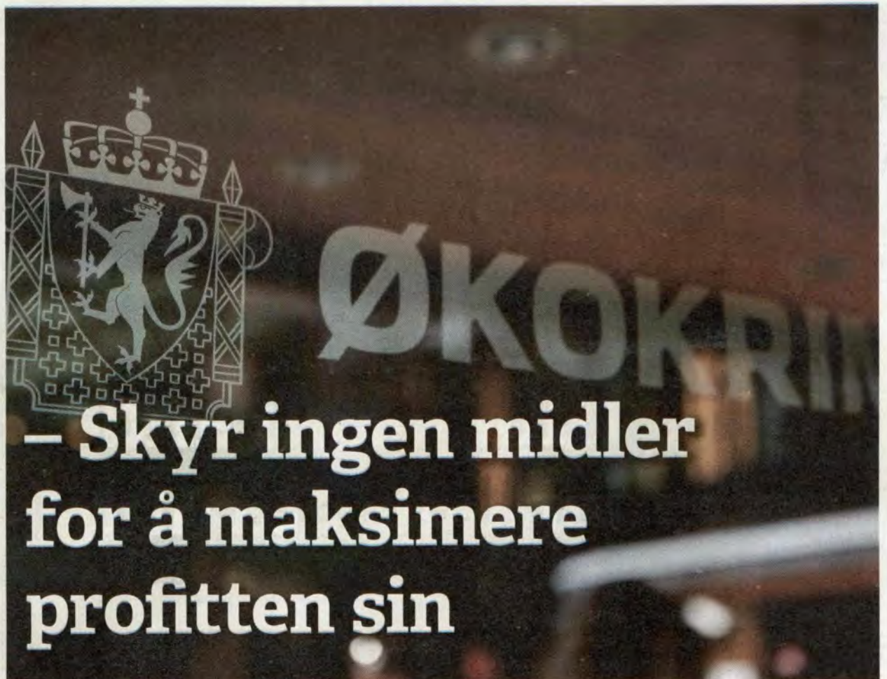
Korrupsjon: Økokrim har tiltalt tre tidligere regiondirektører i Stendi for grov korrupsjon.

Rødt vil de kommersielle velferdsprofitorer til livs, og sikre en reelt profittfri barnehagesektor med både offentlige og ideelle barnehager. Det skal vi jobbe for å få med et nytt flertall på.