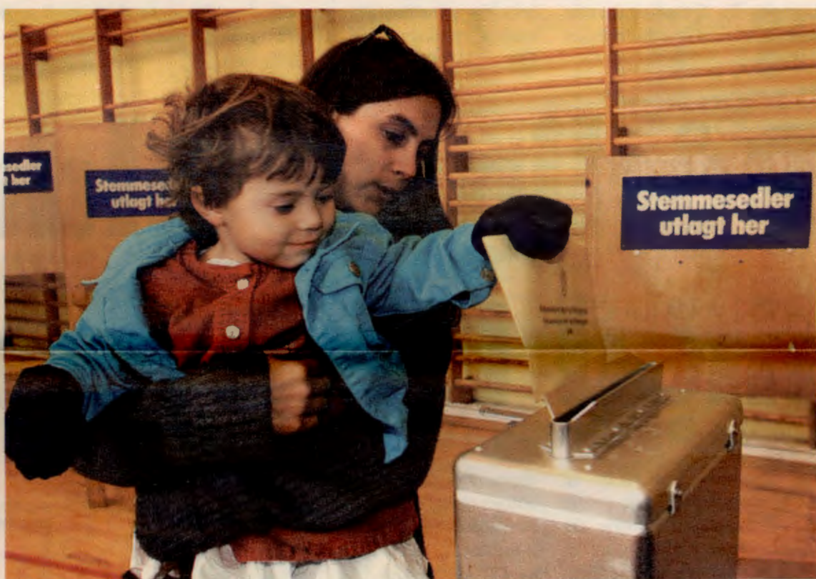
Bruk stemmeretten mandag 10. september.

La oss gjøre en endring på de siste valgenes trend med lav valgdeltakelse på østkanten! Møt fram og stem! STEM FOR FORANDRING!