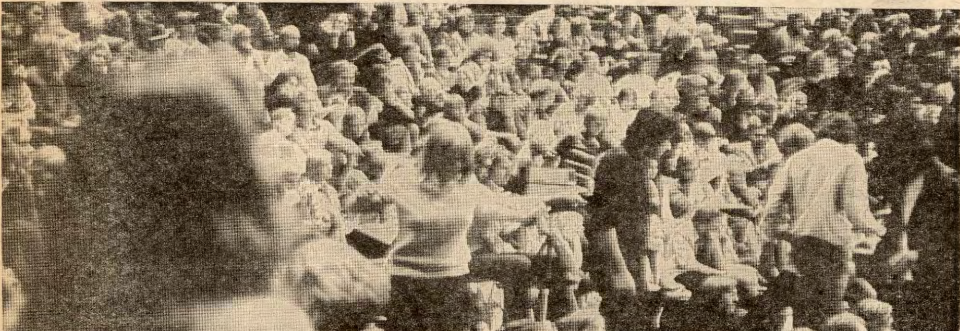
Jubel til trengsel var det også i Chateau Neuf hvor Studentersamfundet holdt valgveke...

«Fløtt deg EEC, du står i veien for sola». Nei-ungdom var samlet til valgveke i Det norske Studentersamfund i natt. Storsalen i Chateau Neuf var fylt til siste plass, og ved midnatt ble en reservert pessimisme snudd til glede, med trampeklapp og allsang.