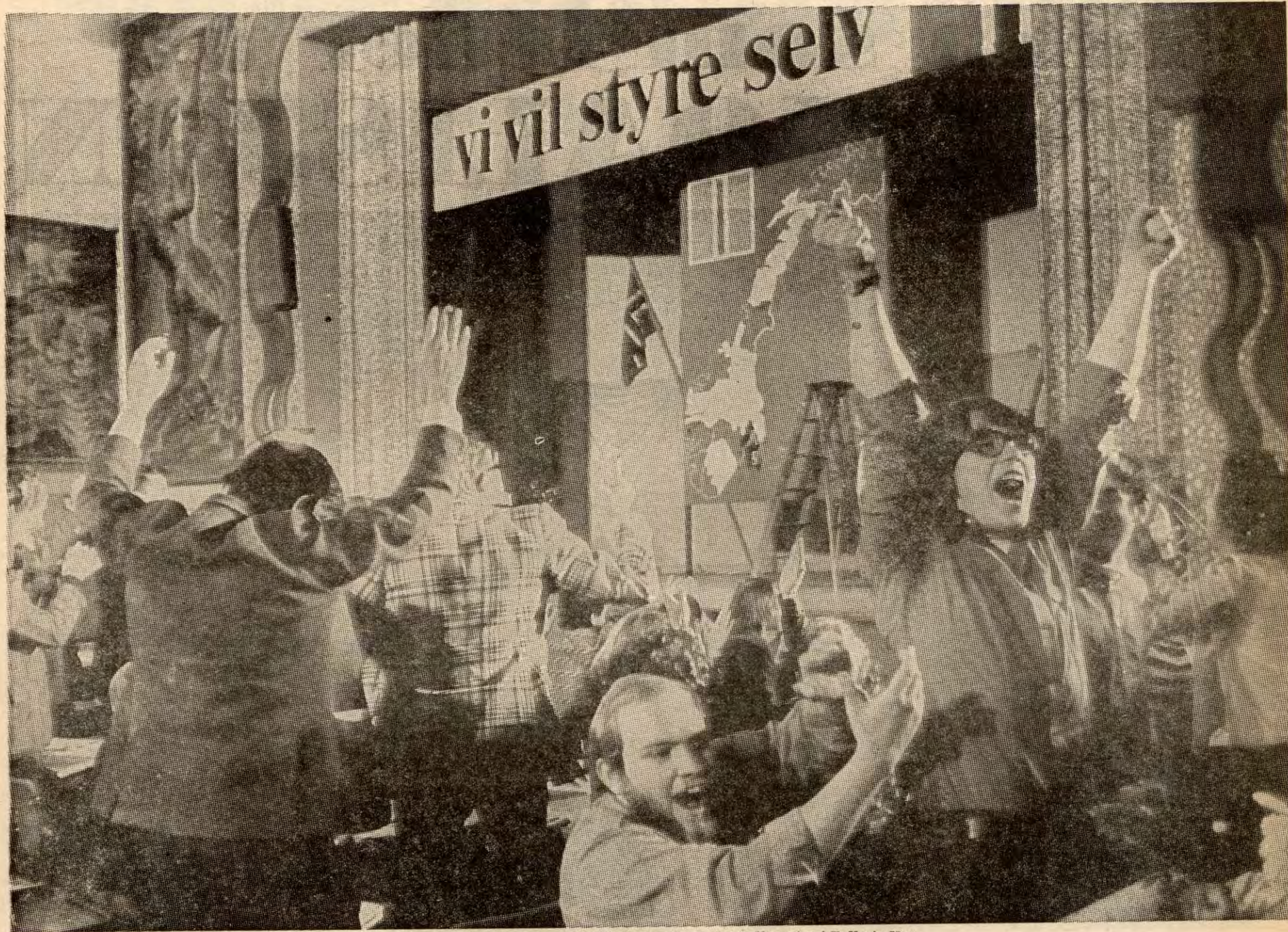
Jubelrop og ungdommelig seiersdans i Folk-ebevegelsens hovedkvarter i Folkets Hus.