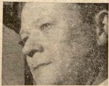
Statsminister Krag — norsk nei på grunn av forhandlingsresultatet for landbruk og fiske.

Slaget om EF er imidlertid ikke tapt i Danmark på grunn av Norges stilling. Statsminister J. O. Krag fastholdt i natt at Danmark vil gå inn i et utvidet Fellesmarked uten Norge. Han sluttet seg til formannen for det konservative folkepartis folketingsgruppe, tidligere finansminister Erik Ninn-Hansens uttalelse: