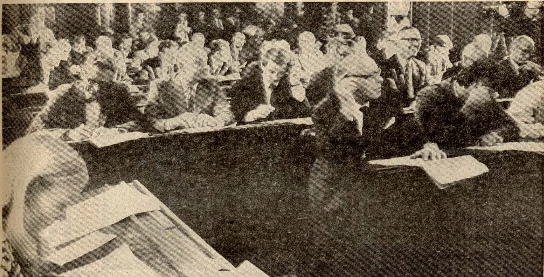
Det var mer enn dobbelt av det vanlige fremmøte på Oslo Børs i går, nesten 80 personer i alt. Og fall truet omtrent alt, bortsett fra lysekronene — som man ikke trengte fordi TV var til stede med sitt flomlys...