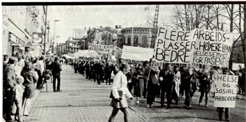
»Felles kamp mot statens helsefarlige bevilgningspolitikk.» 300 helse- og sosialarbeidere deltok i Rød Arbeiderfronts demonstrasjonstog i Oslo 1. mai 1971.