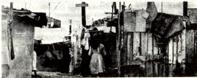
Slik bor fremmedarbeidere i Paris.

De grelleste eksemplene på fremmedarbeidernes boligforhold er klynger av