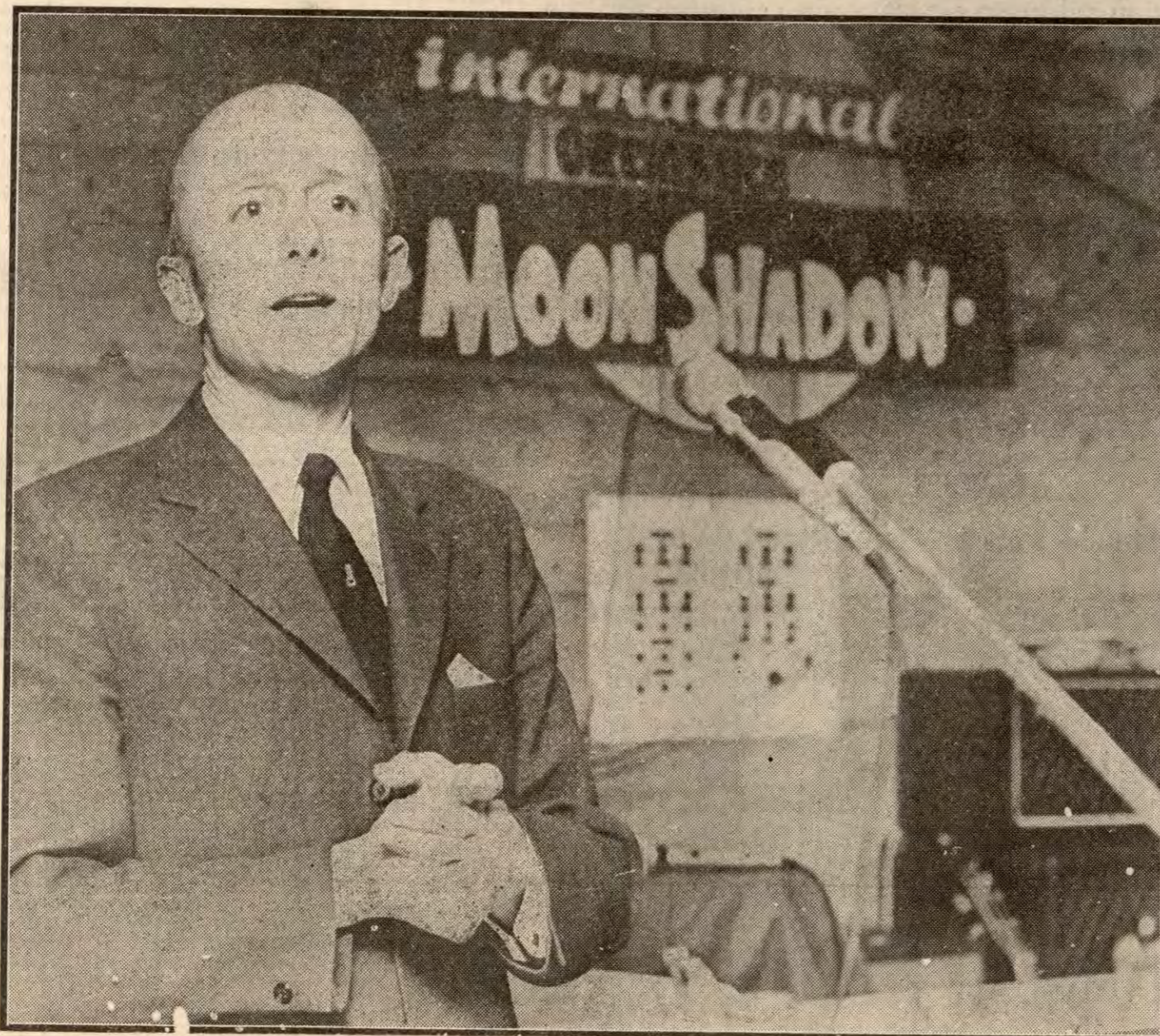
Kåre Willochs lederposisjon i Høyre er trygg uansett valgutfall.