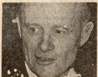
... og Bondelaget vil støtte Mellbye.