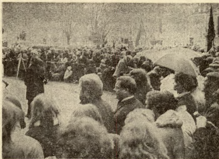
Om lag 10 000 mennesker var samlet utenfor Folketinget i København.

«Foråret» er i ferd med å trengje gjennom i Danmark, også for EF-motstanden. I regn, blåst, med enkelte solgløtt samlet det seg over 10 000 mennesker, ifølge dansk politi og TV,