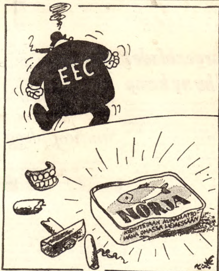
Slik fremstiller tegneren i den finske avisen «Helsingin Sanomat» EFs forsøk på å få Norge med som medlem.

«På denne bakgrunn oppfordrer vi til debatt omkring disse problemene under forberedelsene av neste LO-kongress. Folkeavstemningen og arbeidsplassenes syn må bli retningsgivende for LOs framtidige politikk», heter det i erklæringen fra Folkebevegelsens faglige utvalg.