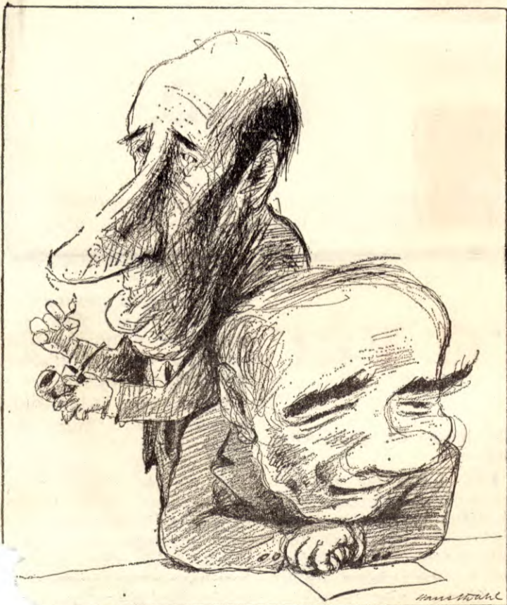
hjelper det om Nei-folket vant folkeavstemningen når vi vinner nasjonene!

«En hadde håpet, skriver Arbeiderbladets korrespondent i London, at nettopp EF-medlemskapet skulle åpnet slusene for nye investeringer, ny produksjon og større konkurransedyktighet. Nå forteller derimot ekspertene at den vekst som politikerne hevdet var i gang, er mer av en boble enn en boom.»