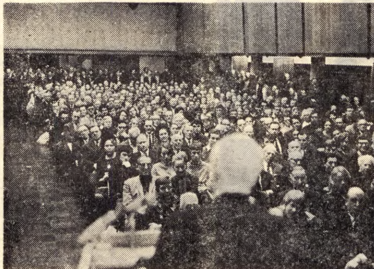
Fra et av Folkebevegelsens møter i Oslo.

Folkebevegelsens faglige utvalg sammen med Arbeidernes Ungdomsfylking, SF's Ungdom og Kommunistisk Ungdom, arrangerer i dagene 21.—22.—23. januar, stor faglig/politisk konferanse i Samfunnssalen i Oslo. Arrangementet blir i tre saler og delvis lagt opp som et «teach-in». Søndag 23. januar er avsatt til landskonferanse for Folkebevegelsens tilhengere i fagbevegelsen. Da skal det velges et faglig landsråd.