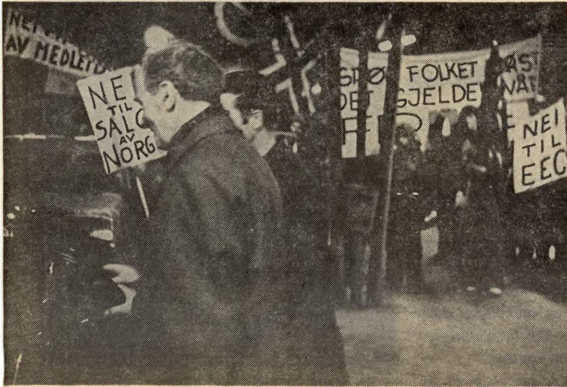
Statsminister Trygve Bratteli tok seg ikke tid til å lese hva som sto på plakatene til demonstrantene som møtte han på Fornebu sent søndag kveld.

Dersom Bratteli hadde ventet svingende faner, vaiende flagg, hyldningstaler og hurrarop da han vendte hjem fra sin propagandareise til EEC-landene, måtte han bli skuffet. Norsk ungdom har sluttet å bifalle forsøkene på å tilpasse Norge til Roma-traktaten, Kontinentets storindustri og EEC's embetsmannsvelde.