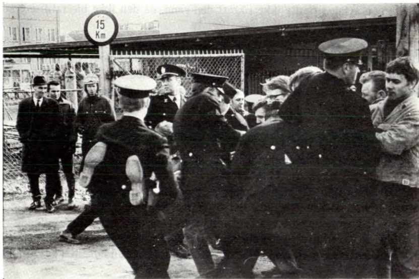
Politiangrep på streikende Norgas-arbeidere.