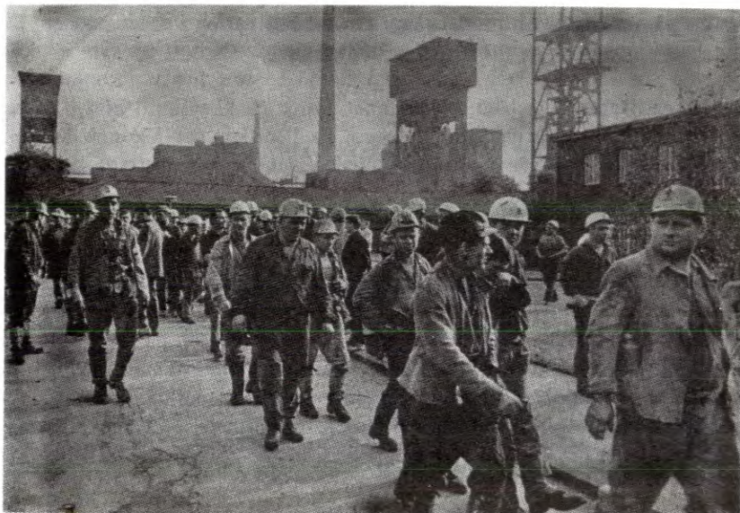
Streikende gruvarbeidere i Dortmund, Vest-Tyskland. 10 000 arbeidere deltok i streiken i Dortmund.

Utviklingen innen kull- og stålproduksjonen innen EEC er et godt eksempel på hvordan monopoliseringen øker kapitalens utbytte av arbeidskraften. Allerede i 1951 opprettet kull- og stålmonopolene i Benelux-landa, Tyskland, Frankrike og Italia Det europeiske kull- og stålfellesskapet (CECA) . Denne organisasjonens overnasjonale organer – som er videreført i EEC – har muliggjort en voldsom strukturrasjonalisering innen kullproduksjonen og en økende konsentrasjon av kapital og produksjon innen stålsektoren. Kullgruvearbeiderstreikene i Belgia er et tegn på at dette har gått ut over arbeidsfolk. Markedsutvalgets rapport I gir klart belegg for dette: »Med finansiell støtte fra Den høyere myndighet har kullindustrien i medlemslandene søkt å møte den nye situasjon gjennom rasjonaliseringstiltak, særlig ved å nedlegge driften i de minst lønnsomme kullgruvene. Mens det ved slutten av 1957 fantes i alt 416 gruver i drift i Fellesskapet, var tallet i 1965 gått ned til 240. Gruvenes gjennomsnittlige dagsproduksjon gikk opp fra 2085 tonn til 3390 tonn i samme tidsrom. Antall ansatte i kullindustrien gikk ned fra 800 000 i 1960 til ca. 700 000 i i 1965. Herav var ca. 100 000 utenlandske arbeidstakere, ca. 1/4 fra andre medlemsland og ca. 3/4 fra tredjeland.»