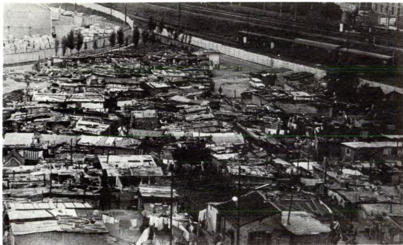
Slik bor fremmedarbeidere i Paris.

For effektivt å fremme strukturrasjonaliseringen og å gjøre bruk av dem som blir arbeidsløse som følge av rasjonaliseringen har EEC opprettet «Det europeiske sosialfond». Det brukes til å omskolere og tvangsflytte arbeidskraften. Markedsutvalgets rapport I sier: «Et meget viktig arbeidsmarkeds-politisk virkemiddel er Det europeiske sosialfond, traktatens artikler 123-27. Fondet har til formål å fremme sysselsettingen og arbeidskraftens geografiske og yrkesmessige bevegelighet. . .» Videre heter det at fondet inngar som et ledd i kampen mot «lite lønnsom sysselsetting», et pent uttrykk for at fondet skal brukes til å rasjonalisere bort arbeiderne i industrier som ikke gir monopolkapitalen høy nok profitt. I perioden 20. september