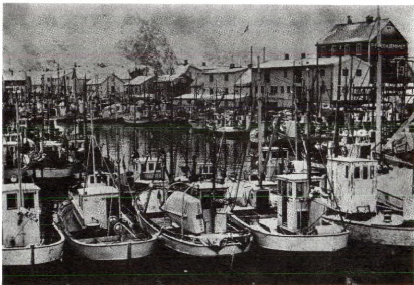
Fiskebåter ved kai i Henningsvær. Er dette synet snart en saga blott?

Innen fiskesektoren ser vi det samme. Fiskarbankens utlån gis konsekvent til folk og rederier som vil skaffe seg store båter. Det er mye lettere å få lånt 1 million kroner til en stor båt enn 10 000 kroner til en liten. Dette harmonerer godt med EEC's regler, hvor statsstøtte bare kan gis til bygging av fiskefartøyer på 50 bruttotonn eller mer. Samtidig har sjarkefiskerne i stor grad vært holdt utenfor minstelottsordningen. Også den direkte statsstøtten