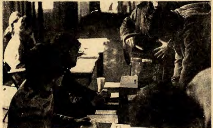
FRA EN AV STEMMEURNENE PÅ BLINDERN

Kun to plasser fikk EEC-tilhengerne flertall, nemlig som ventet på Norges Handelshøyskole (366 mot 266) og på Jus en overvekt for på 8 stemmer. Altså kun blant typiske business-studier.