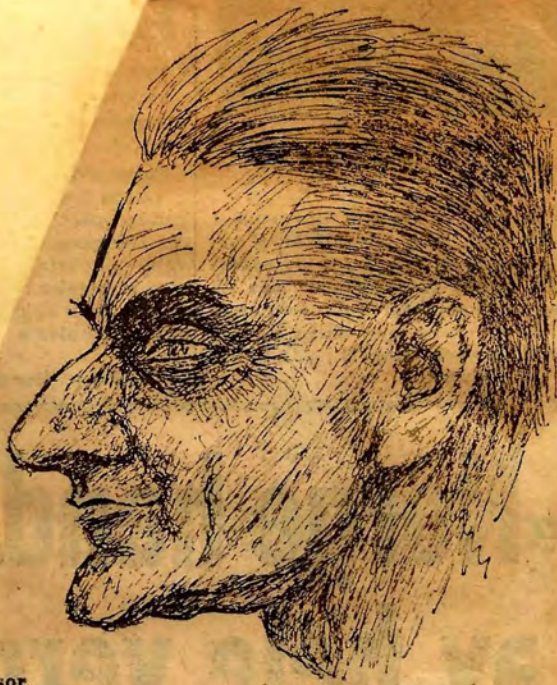
Professor Ragnar Frisch.