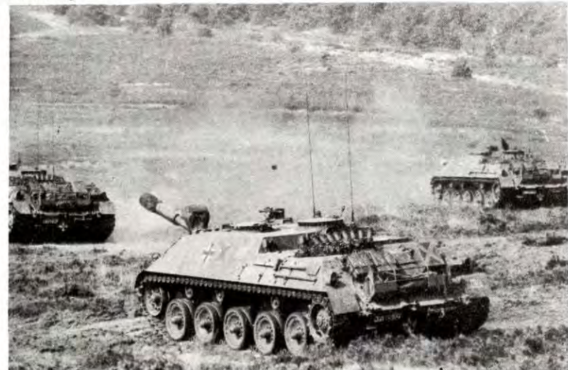
Tyske tanks rykker fram. Fra den 65.000 mann store NATO-øvelsen nord i Vest-Tyskland i september 1969.

Den gigantiske NATO-øvelsen Strong Express star for døra – 14. til 23. september. Vi skrev i forrige nummer av Klassekampen at dette var en øvelse som egentlig er rettet mot det norske folket, en trening i invasjon, rettet inn på å vise at NATO raskt kan »tsjekkosllovakisere» Norge om nødvendig. VG har oppdaget vart poeng, og har problemer med å argumentere mot det – og slar det derfor bort i en spøk. Men vi har ikke rad til den slags. Øvelsen kommer like før folkeavstemninga, og vi kan enna ikke vite hvor intenst EEC-tilhengerne vil bruke øvelsen i sin propaganda. Vi ønsker derimot å vise hva øvelsen stiller i spissen: Spørsmålet om i hvilken retning EEC vil utvikle seg m i l i t æ r t.