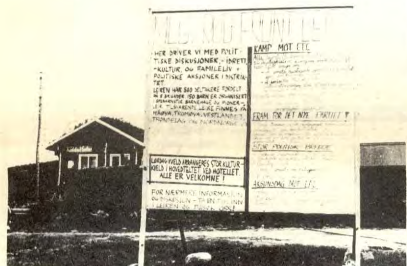
Bygdefolk og turister var velkomne til MLG's Østlandsleir. VG måtte nøye seg med å ligge i skogkanten med teleinse.

I år var det leirer sju steder i landet. Det er mer enn en dobling fra i fjor. Vi er overbevist om at de tusener som var på leir har trukket mange gode erfaringer, og vi oppfordrer alle progressive til å ta kontakt med marxist-leninister som de kjenner for å få rede på hvordan de kan komme på Rød Front sommerleir til neste år.