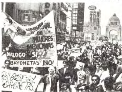
OL, Mexico 1968. Mexikanske mødre demonstrerer mot fengslinga av deres sønner og dotre.

Det er ikke fremme av kameratslig kappestrid, internasjonal «forståelse» og fred mellom verdens folk som ligger til grunn for årets olympiade. I dag trenger den vest-tyske monopolkapitalen på ny å vinne verdensopinionen for seg. Få uker før folkeavstemninga vil EEC-propaganda dryppe inn i tusener av norske hjem. Og kappestriden er ikke folkets kameratslige kappestrid. Ved at økonomi og