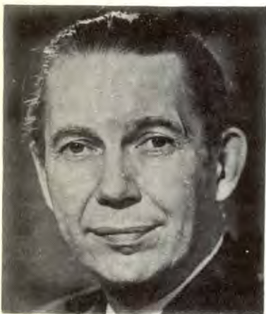
Vi bør kreve at sosialminister Odd Høydahl gir et klart svar på om vi skal få amerikanske tilstander i det norske trygdesystemet.

Klassekampen har fått sikre opplysninger fra Brussel om at EEC-kommisjonen nå arbeider med å bygge ned de sosiale trygdeytelsene innafør EEC. Hvis Norge blir medlem av EEC, vil dette nødvendigvis bety at hele vårt — sett i europeisk sammenheng — godt utbygde trygdesystem blir svekket drastisk. Dette vil bety et av de mest alvorlige angrepene på arbeidsfolks levevilkår som vi har blitt utsatt for på tiår!