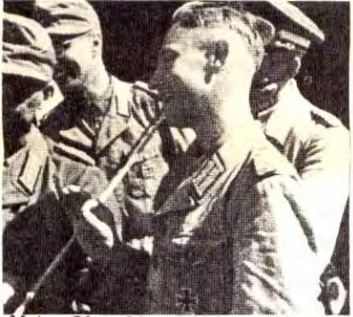
Major Ohne Mutze forteller, med en talende handbevegelse, sine grensevakter at nå er den »naturlige samordning« snart til ende. (Sommeren 1942)

Kircher i Frankfurter Zeitung skriver at et Europas forente stater kanskje kan oppstå som et resultat av den nåværende styrkeprøven. Tyngdepunktet i dette Europa, skriver han, kommer ikke til å ligge i England og Frankrike.