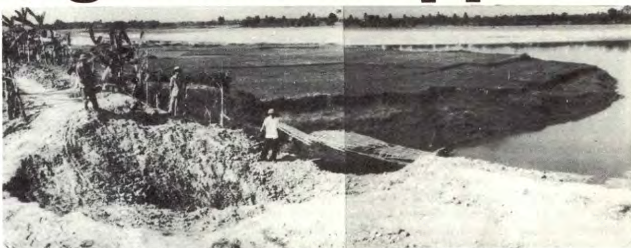
Bombekrater i diken, Ngoc Quang-slusen ved Chu-elva i Nord-Vietnam.

Nixons ville krigspolitikk har blitt møtt med kraftige reaksjoner fra hele verden. Til og med paven og FNs generalsekretær Kurt Waldheim har åpent kritisert bombinga av dikene. I denne situasjonen holder den norske regjeringa så godt som kjeft. Utenriksminister Cappelen presterte et «god dag mann økseskaft-svar» i særklasse da spørsmålet ble reist på Stortinget. Det faller tydeligvis DNA-ledelsen vanskelig å innta folkets standpunkt i noe som helst spørsmål i disse EEC-tider. Det betyr at vi må tvinge dem til det. Ta spørsmålet opp i fagforeninger og organisasjoner, — vis at vi står på det vietnamesiske folkets side, ikke minst nå som vi sjøl kjemper mot imperialismen, mot EEC. Krev et utvetydig standpunkt av tåktalerne i regjeringa — krev Saigon-quislingene i Norge utvist fra landet.