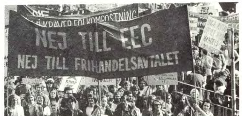
Kampen mot frihandelsavtalen med EEC sto sentralt i årets 1. mai-demonstrasjoner i Sverige. Her et bilde fra Stockholm.

Stolt fortalte flyktningene om hvordan de i dag — mot FN's vilje — arbeidet med å forbedre leirene. Klokker blir dekket til, egne skoler ble reist, de reaksjonære