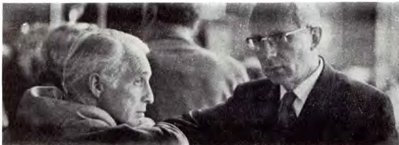
»Sjefsforhandler Sommerfelt og statsråd Kleppe virker bekymret.

Kort sagt: Vi tror ham ikke, topp-aristokraten. Han og hans like tenker nok på lang sikt. Alle DNAtvilere bør merke seg dette og ikke la seg lure av Brattelis taktikk »får jeg ikke ja, så går jeg!»