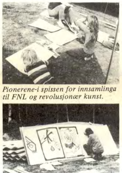
Pionerene i spissen for innsamlinga til FNL og revolusjonær kunst.