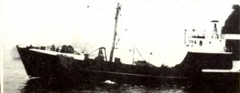
Den britiske tråleren skjuler navnet sitt med ei strie mens den bryter den islandske 12-milsgrensa under torskemilkrigen i 1958. Britiske kanonbåter beskyttet da monopolenes trålere.

I norske fiskeriområder har Island stor støtte: Finnmark fiskarlag krevde nylig