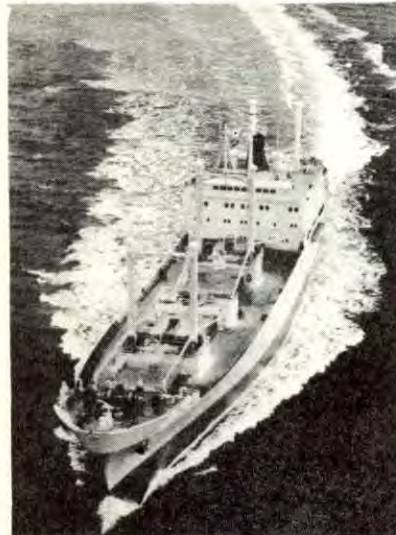
Sjøfolk vil være med på å bryte redernes kurs mot EEC.

Dersom norsk hjemmeindustri blir lagt åpen for konkurranse fra disse kapitalsterke foretak, vil vesentlige deler av våre arbeidsplasser hjemme være truet. Dermed vil norske arbeidere være et stort tilskudd til den »frie« og bevegelige arbeidskraften som må søke arbeid i industriområdene i Europa. Som sjøfolk har vi sett litt av hvordan fremmedarbeiderne lever i svære områder med plankeskur, bilvrak og campingvogner som boliger eksempelvis i Marseille og Paris. Vi ønsker ikke at norske arbeidere skal bli nødt til å leve under lignende forhold.