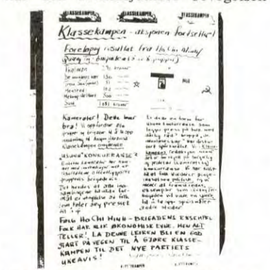
Veggavis i Tuddal om KK-aksjonen levnet ingen tvil: Fram for ukeavis!

Vi kan heller ikke ha illusjoner om at Klassekampen får være i fred når den revolusjonære bevegelsen