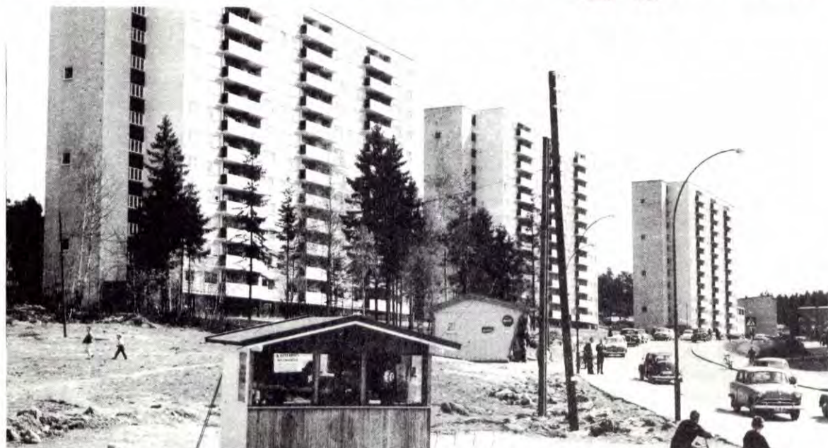
Fra Boler, en av Oslos drabantbyer. 20 % høyere husleie er det minste beboerne må regne med i tilfelle norsk EEC-medlemskap.

Boutgiftene i husbankfinansierte boliger har økt mer enn 20 prosent hvert år fra 1965 til i dag. I 1965 måtte en industriarbeider gjennomsnittlig betale 19 prosent av lønna si for å bo i en blokkleilighet finansiert av Husbanken. I dag må han ut med over 23 prosent. Regjeringa vil gjerne gjøre inntrykk av vilje til å gjøre noe. Derfor har de bebuda tiltak som skal redusere utgiftene for spesielt vanskeligstilte. Men pengene skal de ta fra andre som bor. Nemlig folk i eldre boliger som endelig har klart å betale ned det meste av gjelda på hus og leilighet. Her skal vi vise litt hvem som tjener og hvem som tapet