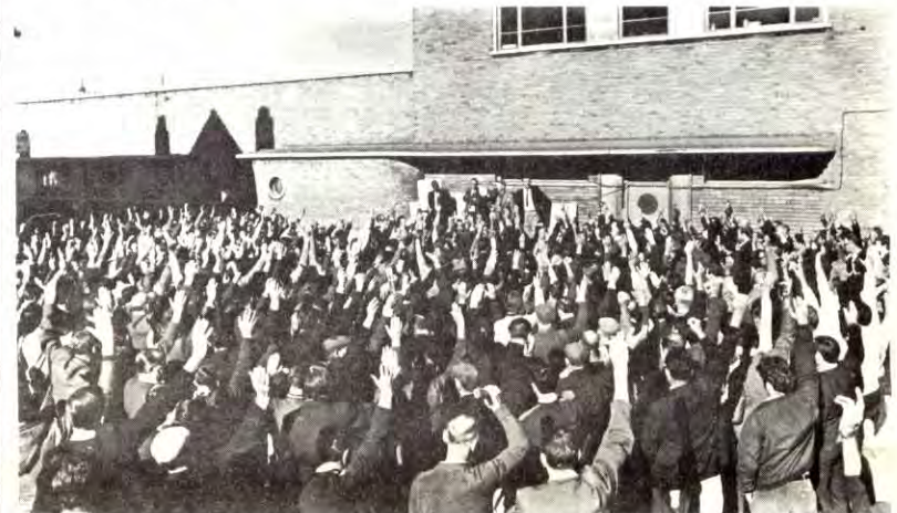
Havnearbeiderne i Southampton stemmer nei til lossing av bedervelig mat. Det dreier seg om frukt, kjøtt og fisk fra Sor-Afrika.

Men havnearbeiderstreiken skiller seg fra tidligere streiker når det gjelder organiseringa. Streiken ledes i realiteten