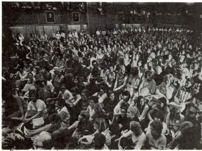
Den enorme oppslutninga og den sterke tilliten til ledelsen på sykepleierenes allmannamøte 10. august, markerte en styrke bak kravene som nok myndighetene vil merke i tida framover.

Men færre sykepleiere, rasjonalisering og lavere kvalifikasjonskrav til pleiepersonalet betyr dårligere helsestell. Derfor er sykepleieraksjonen ikke bare en rettferdig reaksjon fra en diskriminert gruppe. Kampen de har reist er også en del av vår felles kamp for en skikkelig standard på helsesektoren.