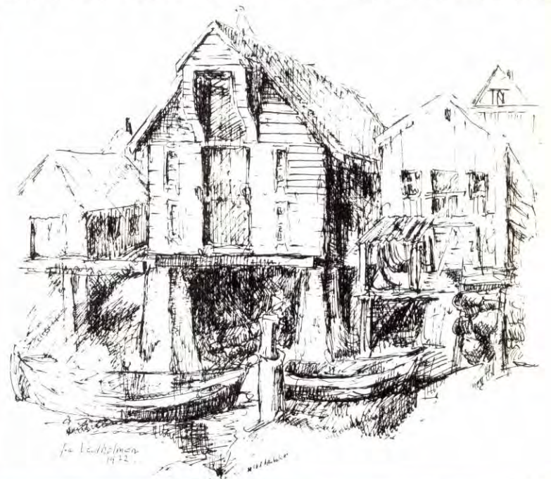
fra Veidholmen 1972

langs. Egentlig skulle vel stedet for lengst ha falt som offer for strukturrasjonaliseringa, men veidværingene vil ikke ha samfunnet sitt radert bort. Når øvrigheta sier »nei», eller »ikke på det nåværende tidspunkt», holder folket på Veidholmen fortsatt på sitt, like strie som nord-