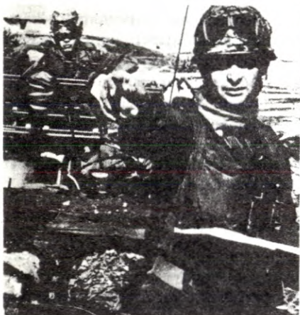
12 av Vest-Europas 24 NATO-divisjoner er i dag vest-tyske.

En viktig oppgave har derfor vært å bygge opp allierte militærmakter som kan beskytte USA-imperialistenes investeringer i utlandet. Vest-Tyskland og Japan har vært de mest framtreddende juniorpartnerne, ikke minst fordi USA etter krigen har hatt anledning til å kontrollere utviklinga i disse landene. I Europa står i dag Vest-Tyskland fram som den ledende imperialist-makta. At vest-tysk monopolkapital er den sterkeste, framgår tydelig av den »alliansen» som bygger seg opp mellom monopolkapitalen i Storbritannia og Frankrike, som gjør at Frankrike i dag ikke avviser britisk medlemskap i EEC fordi dette vil true den franske lederposisjonen som det gjorde i 1962. I kampen om revaluering av den tyske marken avspeilte tydelig maktforholdet seg. At marken i dag flyter, er et godt tegn på styrkeforholdet.