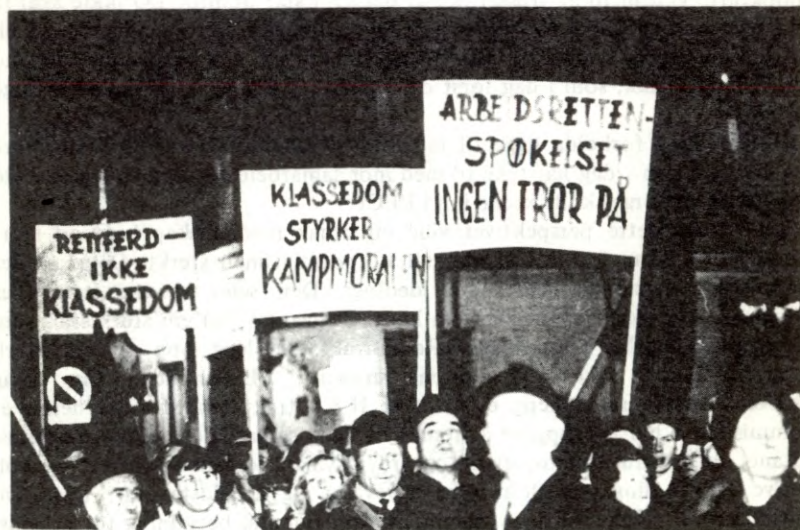
Sporveisbetjeninga avslørte Arbeidsretten

Norgas-arbeidarane i Oslo gjekk til streik. Dei visste at krava deira var rettferdige, og då Arbeidsretten dømde streiken ulovleg, sa Sauda Fabrikkarbeiderforening i ei støtteerklæring, at spørsmålet ikkje var »kva som er lovleg, men kva som er rettferdig».