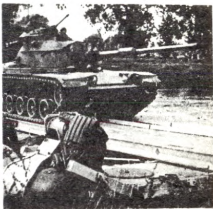
NATO-tank fra amerikansk panserdivisjon krysser Donau. Brua er bygd av tyske soldater fra NATO's ingeniørvåpen.

Nasjonale konsesjonslover, tollmurer, kvoteordninger er blant de politiske tiltaka som har vært av avgjørende betydning for monopolkapitalen i en oppbyggingsperiode (jfr. artikkel om monopolkapitalen og nord-sørstatenes kamp i USA). Imidlertid er dette som før var en forutsetning for ekspansjon, i dag blitt et viktig hinder som må fjernes, nye og mer »fine markedsordninger må nås». EEC er en slik ordning. Og det EEC-framstøtet som i dag retter seg mot det norske arbeidende folket, kan sammenliknes med imperialist-framstøtet mot det indokinesiske folket. Om metodene er forskjellige, er hensikten den samme. Monopolkapitalen sto bak Hitler i hans herjinger som