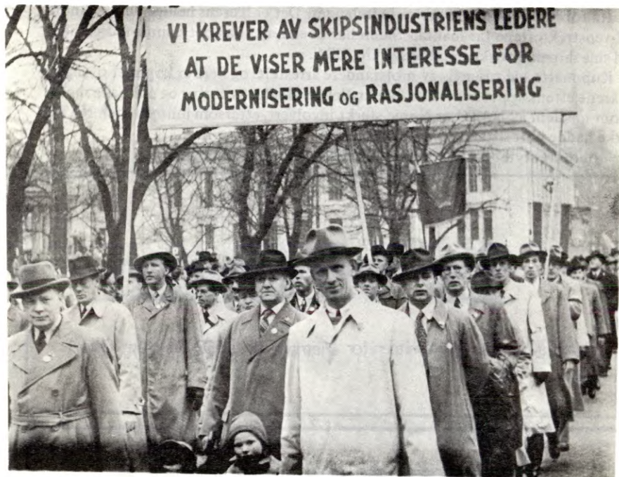
Etter krigen var det gode år for kapitaleierne. LO gikk i spissen for å rasjonalisere bedriftene. Dette bildet er fra 1950 i Oslo.

Spørsmålet om EEC er ikkje minst viktig sett ut frå perspektivet om kva eit norsk medlemskap ville kome til å bety for klassesamarbeidet og kampen mot dette.