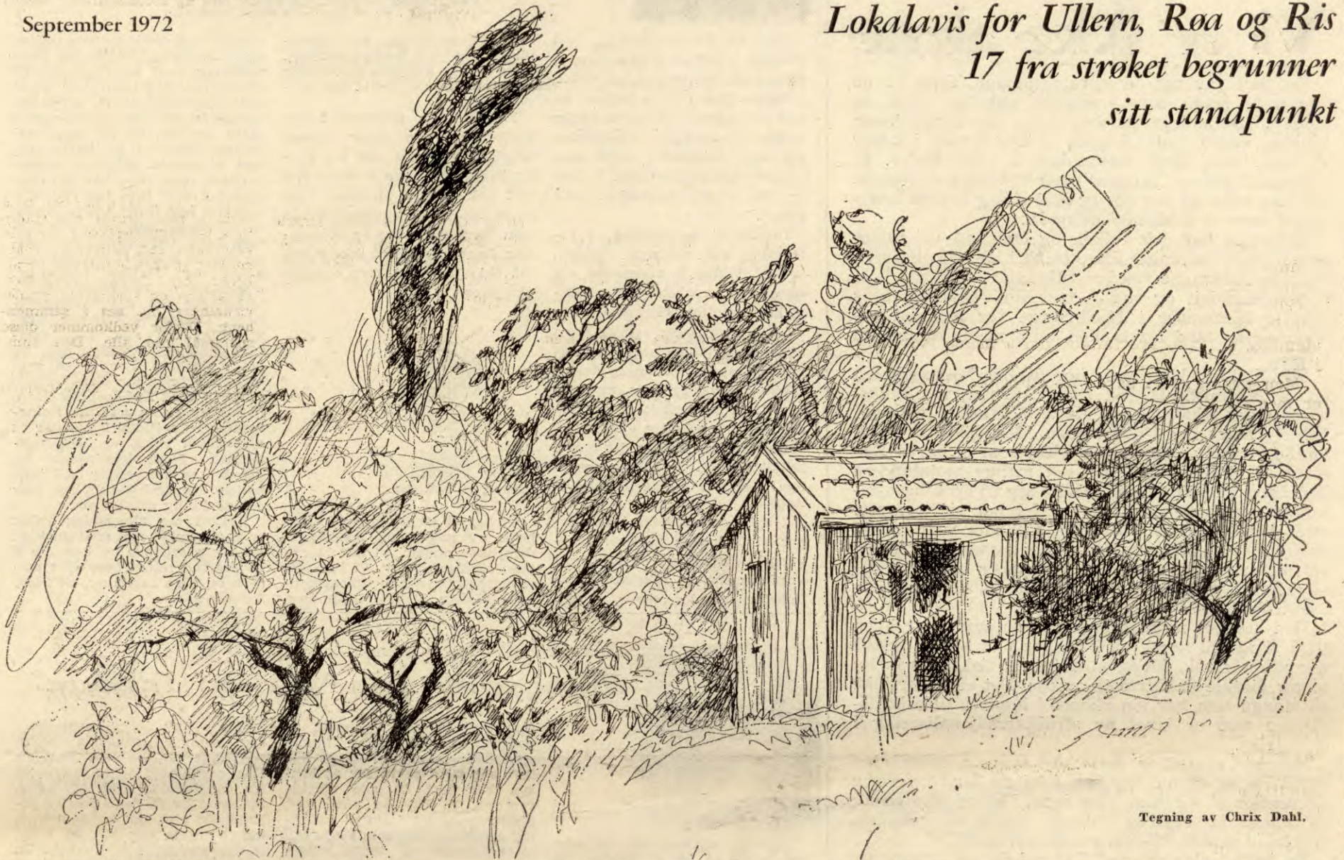
Tegning av Chrix Dahl.

Lokalavis for Ullern, Røa og Ris 17 fra strøket begrunner sitt standpunkt