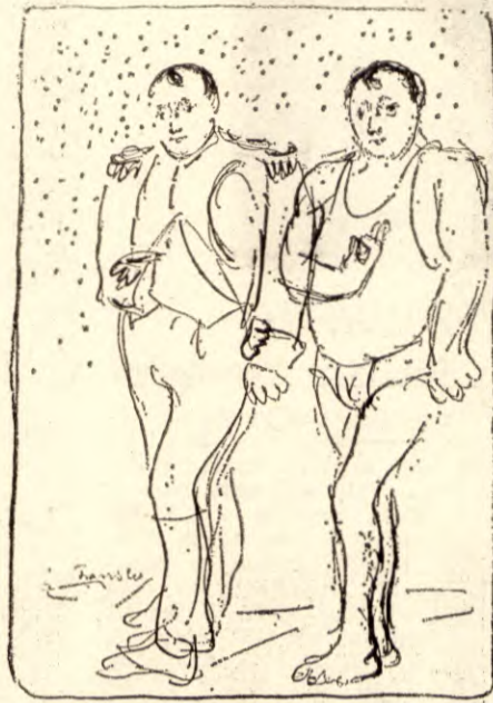
Gammel imperialists drøm. Tegning av Franz Widerberg.

6. Dette, ved siden av Fellesmarkedets klart proteksjonistiske karakter, for ikke å tale om dets u-landspolitikk, vil forsterke istedenfor å redusere misforholdet mellom rike og fattige land, og derved også øke spenningen i verden.