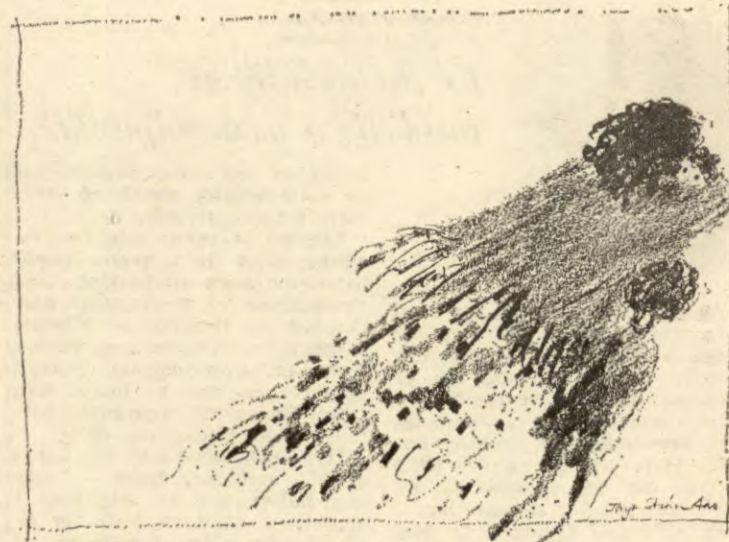
FRA DET STORE FELLESKAPET: JATIL EUROPA NEI TIL SIGØYNERE

Jo, når vi vet at planene for den franske økonomien går ut på å øke nasjonalproduktet med 100 prosent fra 1970 til -80, og