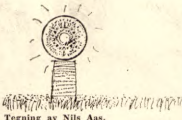
Tegning av Nils Aas.

Kravet om effektivitet og konkurransevne truer mange arbeidstakere: De har for dårlig helse, kan ikke omstille seg fort nok til nye metoder, eller de er ikke følelsesmessig stabile nok. Rasjonalisering og automatisasjon fører også til at ikke minst litt eldre arbeidstakere overflødiggjøres.