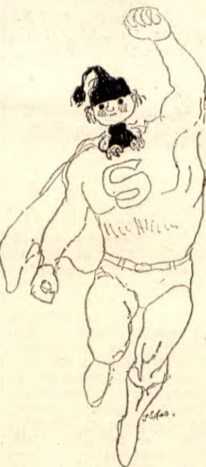
Tegning av Tonje Strøm Aas.

2. Jeg kan ikke godta et system som går ut på at 10 av verdens rikeste land slutter seg sammen med det formål å bli enda rikere, på bekostning av de fattige og mindre utviklede land.