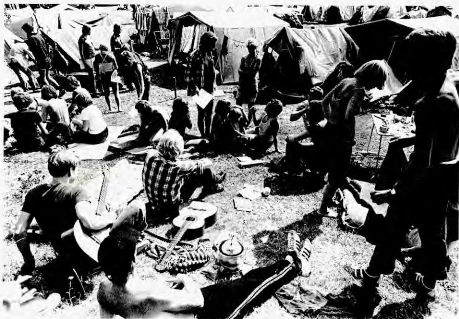
Sommarleirane til RV, AKP og Raud Ungdom har plass til både politikk og hyggelig samvær.

det nesten 1 million til rotasjonskampanjen. Landsrådet meinte dette blant anna var resultat av ei «sterk politisk forståelse for sjølbergingslinja». Rotasjonskampanjen, som gjekk over fleire år, gjorde det muleg for A/S Duplotrykk å kjøpe inn eige rotasjonstrykkeri i god tid før Klassekampen vart dagsavis våren 1977. Utan både gratisarbeid og pengegaver verdt millionsummar hadde det korkje vorti rotasjonspresse eller dagsavis.