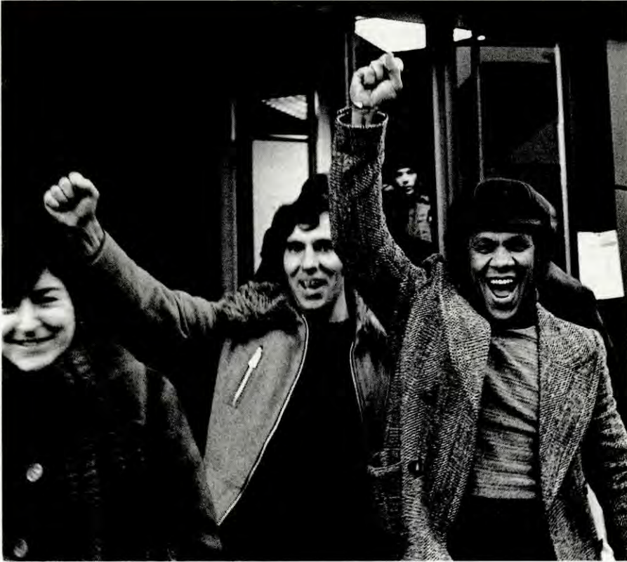
Seier'n er vår: Ingen klarte å splitte kamffellesskapen blant Jøtul-arbeidarane i 1976.

miliane klarte seg – utan streikebidrag frå forbundet. Ei av dei som hjelpte til med støttarbeidet var forfattaren Johanna Schwarz. 2. mars kunne vi på førstesida i Klassekampen lese hennar