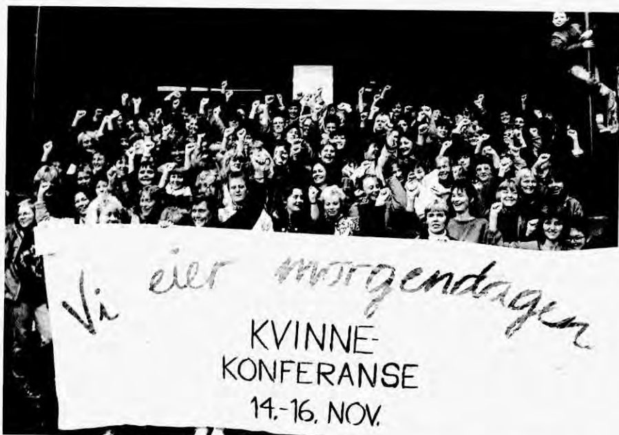
«Vi eier morgendagen». 800 deltakarar møtte fram til den tre dagar lange Kvinnekonferansen som AKP arrangerte hausten 1986.