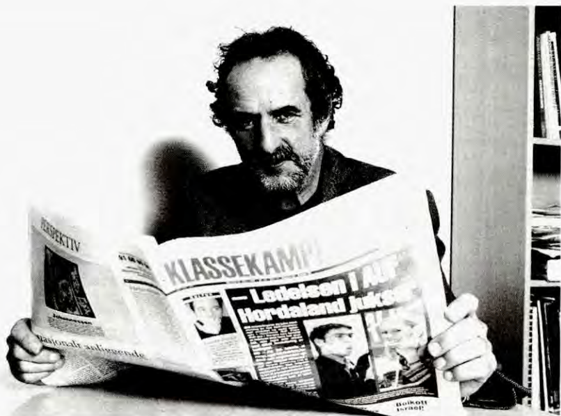
Forfatteren, fotballentusiast og politikaren Jon Michelet, overtok som redaktør for Klassekampen i 1997.

grafen som ikkje vart vedtatt. Ja, stundom verka det som heile føremålsparagrafen var glømt.