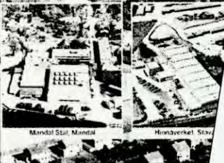
Mandødal Stål, Mandødal