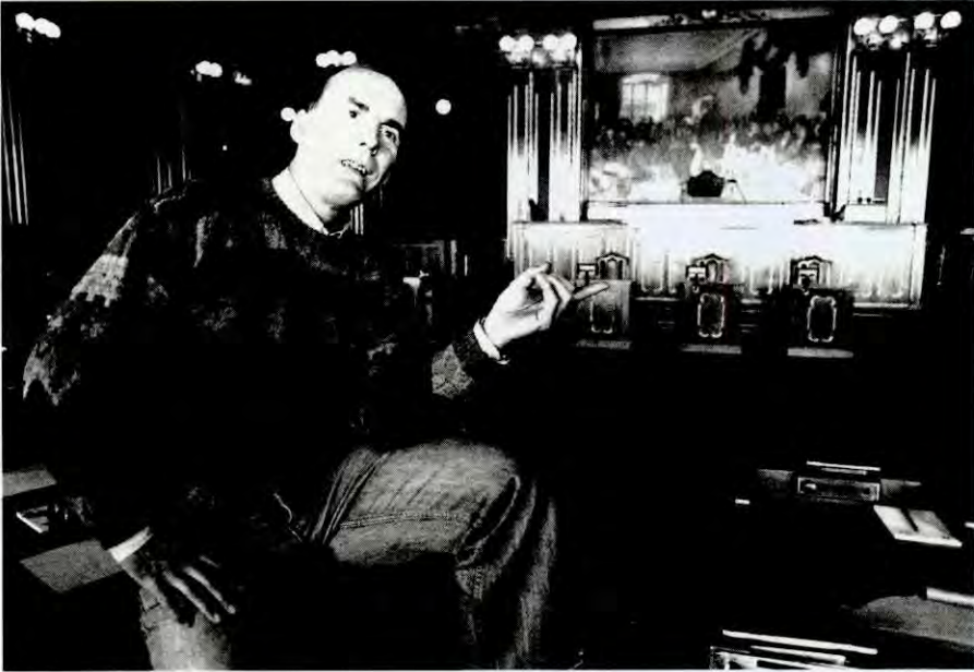
Forfatteren vart første representant frå RV på Stortinget, innvald i 1993 – 20 år etter AKP/RV vart danna..