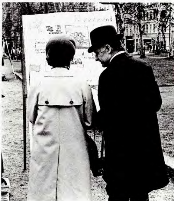
Klassekampen vart eit innslag i bybildet mange fekk eit forhold til – også folk som ikkje stemte på AKP og RV.