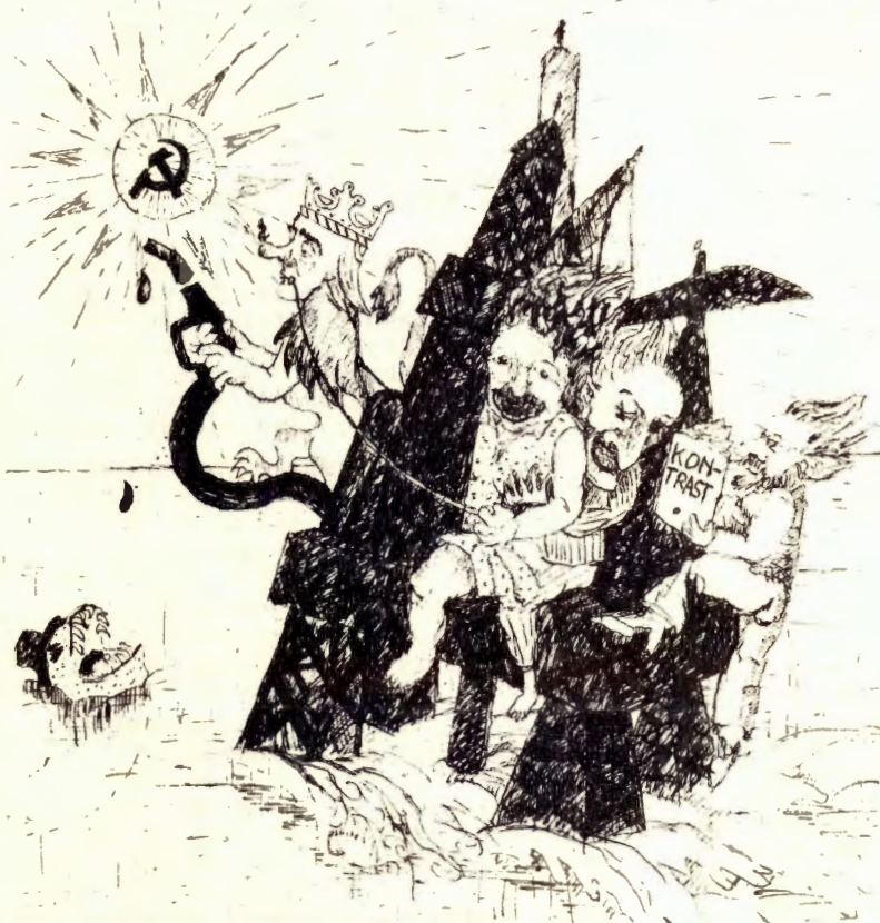
STATSMASKINERI MED SOSIALISME SOM VEDHENG

foruten alle de SV-standpunkter vi har nevnt ovenfor, øyner "avantgarden" i oljepolitikken en utviklingsspiral som riktig håndtert kan føre til sosialismen. Springbrettet er ikke annet enn de statlige organer som bygges opp i forbindelse med oljeutvinningen. Vi leser: "...statens oljeselskap... kan bli et politisk instrument som bruker all sin innflytelse til å presse fram nasjonalisering og sosialisering av det "private næringslivet." (s.5) En slik hardhendt sosialisering kan selvsagt ikke presses fram uten demokratisk støtte: "En vil knapt mobilisere støtte en gang fra arbeiderklassen for en aktiv nasjonaliseringslinje, uten at dette er knyttet sammen med styring, aktiv og demokratisk kontroll på grunnplanet i bedriftene." Og hvordan har så våre perspektivrike stats sosialister tenkt seg formene for "aktiv og demokratisk kontroll" og intim forbindelse mellom stat og grunnplan? Det oppstår