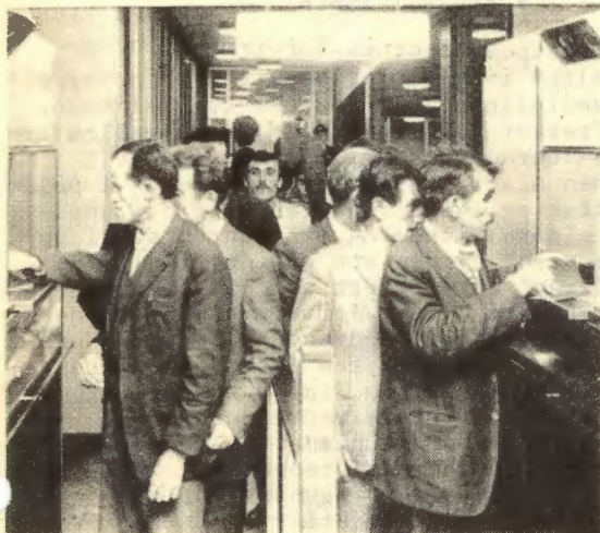
akp's forsvar for demokratiske rettigheter: grensesortering

Nr. 3 1974 Organ for Kommunistisk Universitetslag 2. årg.