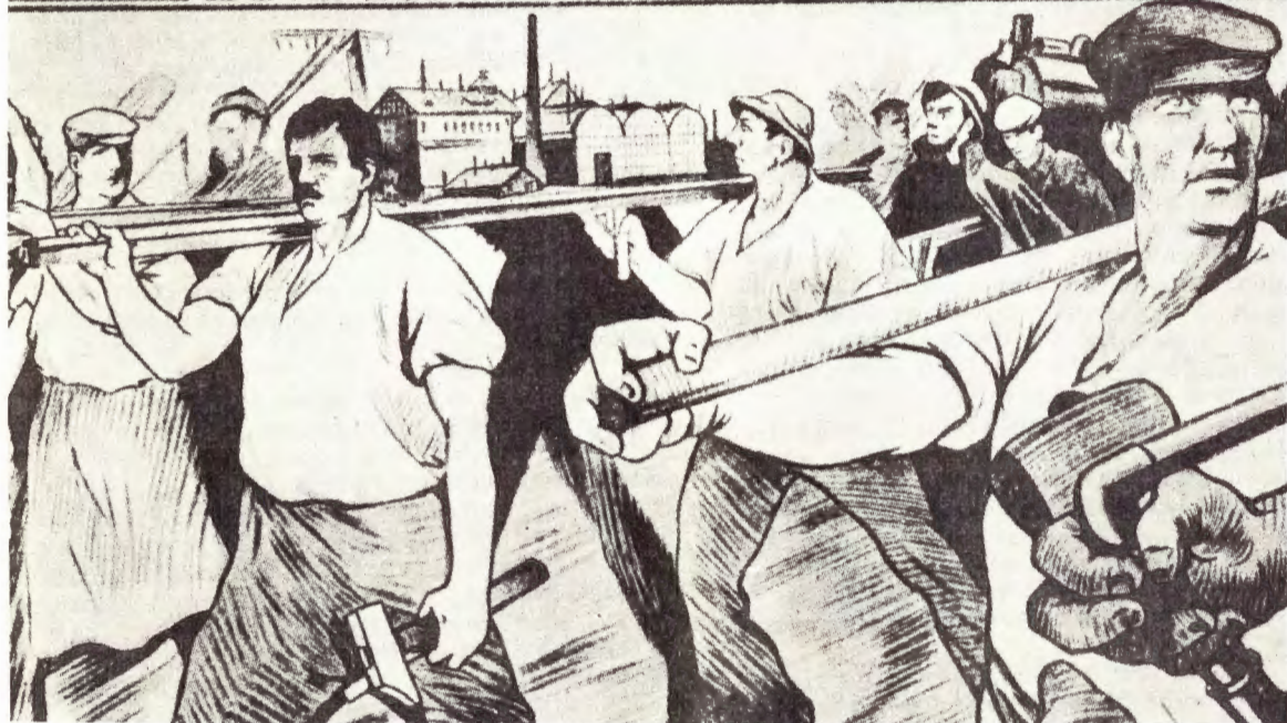
Litografisk trykt plakate fra 1921 af ukendt kunstner. Påskriften lyder: „I arbejdernes

ВРОЖДЕНИЕ ПРОИЗВОДСТВА В РАБОЧЕЙ СТРАНЕ ЕСТЬ ДЕЛО САМИХ РАБОЧИХ.