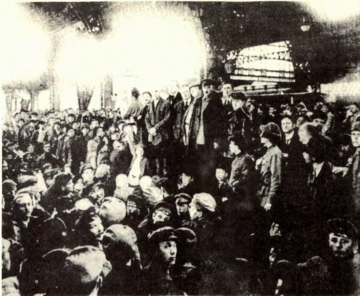
Arbeiderråd St. Petersburg 1917.

I løpet av perioden med krigskommunisme hadde det russiske proletariats blitt kraftig desimert. I 1922 var antallet sysselsatte arbeidere mindre enn halvparten av antallet i 1913, og