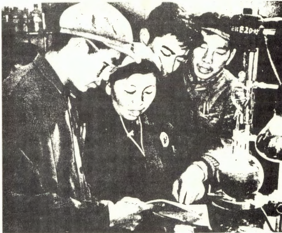
Kina: styrking av proletariatets diktatur.

En slik "gjenforening" er uttrykk for en ny produksjonsmåte først i det øyeblikk det samfunnsmessige fellesskap frivillig arbeider for kollektivet - i forvisning om at ingen enkeltpersoner har privilegier som setter dem i stand til annet enn på sin side å arbeide for det samme fellesskapet. Først da er skillet mellom produksjon og konsumpsjon opphevet, og først da er det materielle grunnlaget for lønnsarbeidet opphevet . En ny produksjonsmåte må være basert på at fellesskapet like