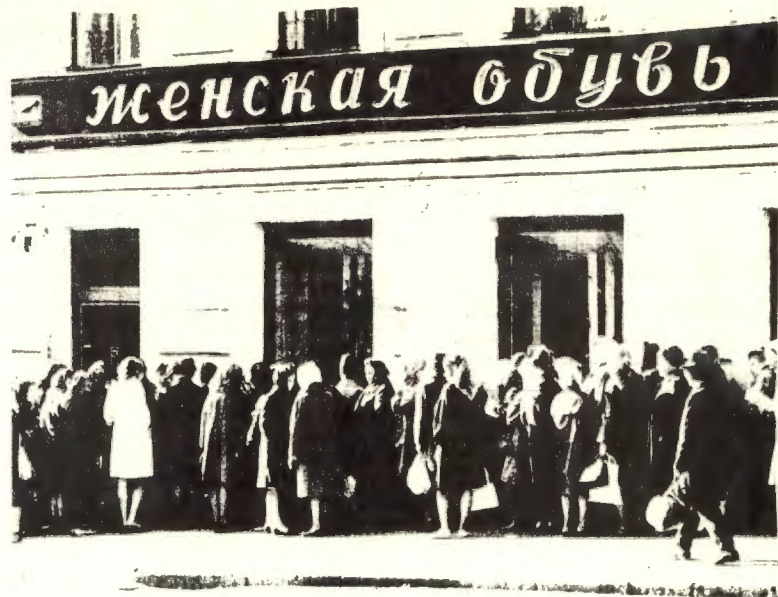
Dagens USSR - kø til konsumvarene.

KEA gir selv et ytterligere godt argument for at Sovjets økonomi er noe helt annet enn bruksverdiproduksjon. I artikkelens siste avsnitt heter det: "Det vi trenger er naturligvis en reanalyse av den indre mekanikk i Sovjet-økonomien..." Men en produksjon dominert av produksjon av bruksverdier, har ingen slik "indre mekanikk". I 1. bind av "Kapitalen", (kap. 8, s. 150 i Pax-utgaven) sier Marx følgende: "Det er ikke kapitalen som har oppfunnet merarbeidet... Det er imidlertid klart at i en økonomisk samfunnsformasjon hvor ikke bytteverdien, men produktets bruksverdi er dominerende, vil merarbeidet være begrenset av en mindre eller større krets av behov, men der vil det ikke ut fra selve produksjonens karakter oppstå et grenseløst behov for merarbeid". I et bruksverdiproducerende klassesamfunn vil merarbeidets størrelse være begrenset av herskerklassens behov, noe også KEA innrømmer: "I Sovjet... er bedriftens levedyktighet bestemt av dens nytte for den herskende byråkratklasse". Men her ser vi at KEA nok en gang har slått seg på munnen. Når størrelsen av merarbeidet på denne måten er begrenset, har ikke økonomien noen slik "indre mekanikk", men vil være bestemt av "rasjonelle" beslutninger, og den tross alt betydelige veksten i den sovjetiske økonomien er bevis nok for at ikke herskerklassens behov er dens drivende motor.