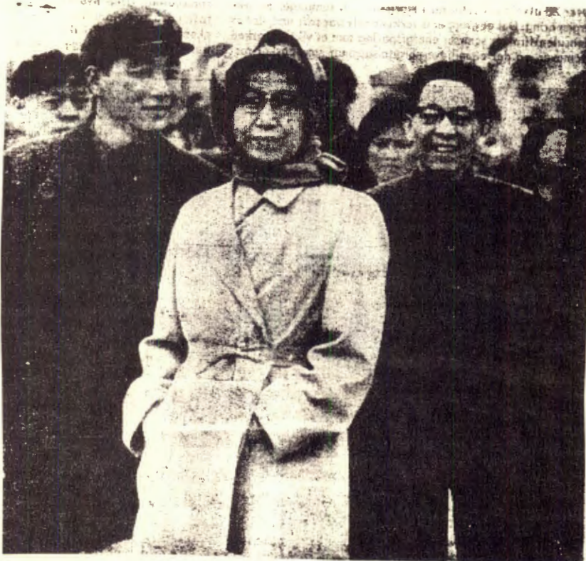
Tre av "fire-banden". fra venstre Wang Hung-wen, Chiang Chin og Chang Chun-chiao.

At kampen i dag står mellom to antagonistiske linjer i det kinesiske kommunistparti, mellom en revolusjonær og en borgerlig politikk, blir bl. a. bekreftet av at de siste dagers angrep rammer langt utenfor de fires tradisjonelle tilhengerskare. Kritikken mot borgermesteren i Peking, Wu Peh, og mot øverstkommanderende for Peking militærdistrikt (som hadde ansvaret for å slå ned på demonstrasjonene på Tien An Men-plassen for et år siden, viser det feilaktige i å betrakte "oppgjøret" som en strid mellom spesielt de fire og Hua-fløyen. Når Teng rehabiliteres, vil det bli stadig klarere at det er det korrekte i de fires politikk, som alle virkelige kommunister i KKP vil forsvare, som trues.