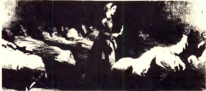
"BEVAR SYKEPLEIEN SOM DEN ER. DET GJELDER VÅRE PASIENTER"

For det første gjelder dette måten reproduksjonsfunksjonene er ivaretatt på. Vi ser ikke noe poeng i å motsette oss funksjonsendringer innen helse- og sosialsektoren som er nødvendige for å ivareta endrede reproduksjonsbehov. Hva enten man "liker" disse endringene eller ikke, kan de ikke stoppes gjennom å holde fast ved funksjoner i overbygninga