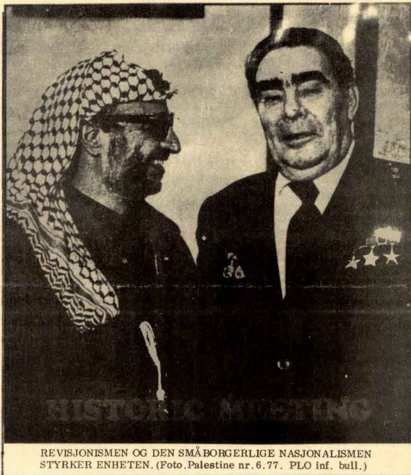
REVISJONISMEN OG DEN SMÅBORGERLIGE NASJONALISMEN STYRKER ENHETEN.

Det en her bør merke seg er at palestineres viktigste base r, nemlig de som ligger i Sør-Libanon, skal overtas av libanesiske militære. Imperialismen og den arabiske reaksjon har ved