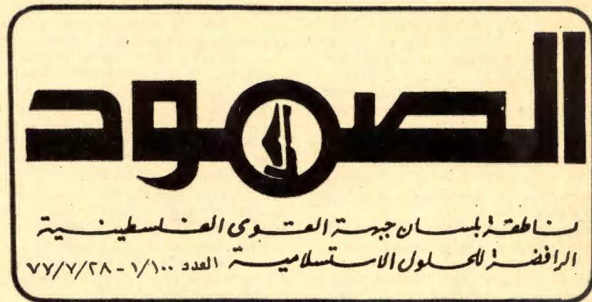
EL SOMOUD Nei-frontens dagsavis.

på det nåværende tidspunkt. Utenriksminister Vance's reundreise, hvis mål var å få de reaksjonære arabiske regimene til å legge press på PLO slik