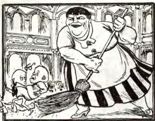
SVs parlamentariske veg til sosialisme?

Dagens venstrebevegelse har sine røtter tilbake til 1960-åra da Folketrygden ble innført, reallønna økte og arbeidsløsheten var lav. SF-ledelsen forkynte at marxismens kriseteori var foreldet og at kapitalismens økonomiske kriser var borte for alltid. NKP vedtok på landsmøtet i 1963 å utsette de siste rester av marxisme i partiets prinsippprogram. I denne idyllen dukket SUF fram med sine slagord om Kultur-revolusjonen, proletariatets diktatur og væpna revolusjon.