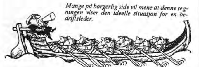
Mange på borgerlig side vil mene at denne tegningen viser den ideelle situasjon for en bedriftsleder.

AKP-bevegelsen er inne i en dyptgående politisk og teoretisk krise. Motløshet og passivitet griper om seg, og det er ingen grunn for oss å juble over det. I stedet må vi utnytte den forvirring og rådløshet som hersker i AKPs omland til å trekke nye krefter med i arbeidet med å utvikle et revolusjonært alternativ til dagens venstrepartier.