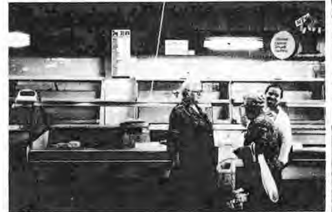
Tomme hyller i butikkene - det er hungersnød blant en del av den polske befolkning.

Innenfor landbruket er det bare aktuelt med øyeblikkelig nasjonalisering av store skogeiendommer og et fåtall storgods. Ellers vil vegen til statsbruk gå gjennom frivillig kollektivisering. Bøndene må overbevises om at et mer rasjonelt landbruk vil føre til bedre arbeidsforhold. Dette forutsetter store bruk som kan utnytte tilgjengelig teknikk effektivt. Dette vil også gi flere og billigere landbruksprodukter