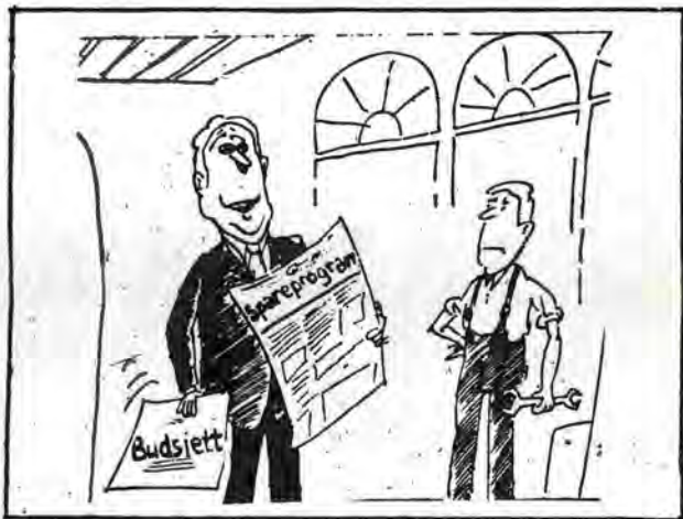
- Vi må alle ofre noe. Jeg må for eksempel ofre deg.

Det er ikke mangel på glupe reformkrav som er årsak til at de sosialistiske kreftene står så svakt i Norge. Så lenge kapitalismen klarer å holde produksjonen i gang vil det bare være små grupper som arbeider for en sosialistisk omveltning. Først når kapitalismen fører til sosiale nedskjæringer, massearbeidsløshet og i værste fall krig, er det mulig med en omfattende radikaliserings av arbeiderklassen. Arbeiderne blir ikke revolusjonære ved å studere marxistisk teori, de bevisstgjøres ved å oppsummere egne kamperfaringer. Først når de ser et alternativ til kapitalismen er de i stand til å styrte borgerskapet og sjøl å overta statsmakten.