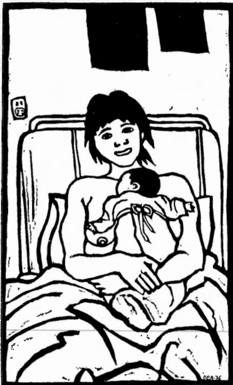
Vinterbarn. Trykk: Dea Trier Mørch