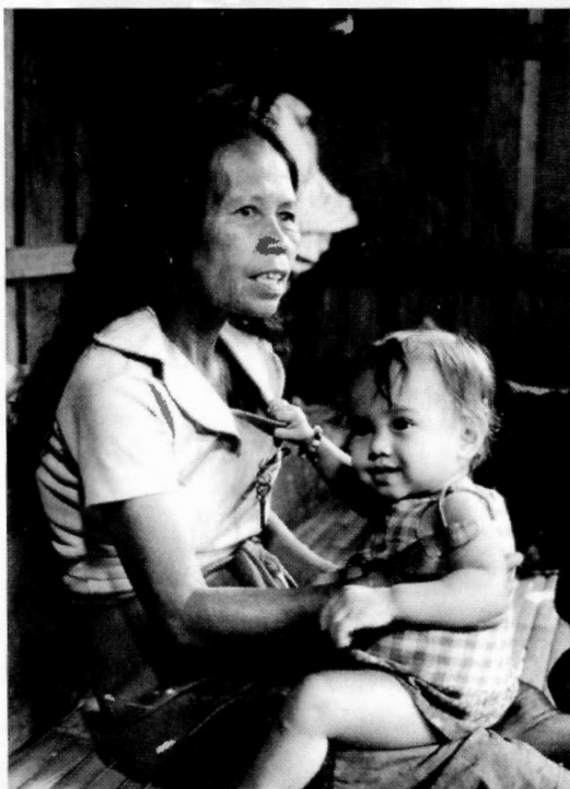
Mor og barn på Filipinene.

kvinner eller rett og slett FNs menneskerettighetserklæring. Selv om slike lover finnes er de veldig ulike i innhold og praktisering fra land til land.