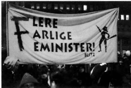
Fra 8. mars 2000 i Oslo

ane dei møter i det sokalla likestilte livet dei freister å føra.